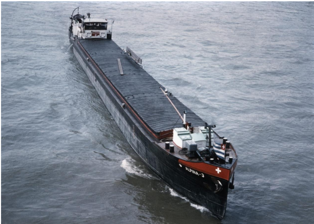
GMS „ALPINA 3“ auf dem Rhein in Basel am 1. Juni 1968